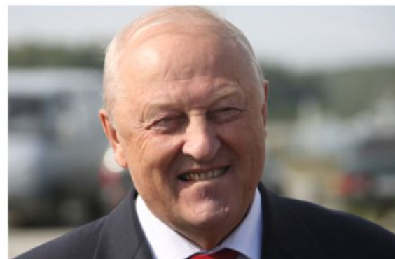
Эдуард Эдгартович Россель