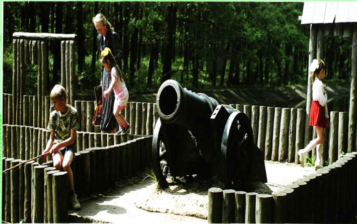
Детский парк Пушкина