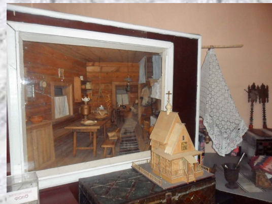
Этнографическая выставка «Русская изба»