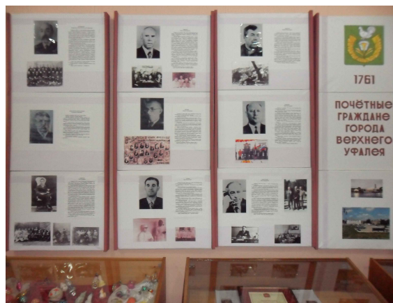
«Почетные граждане города Верхнего Уфалёя»