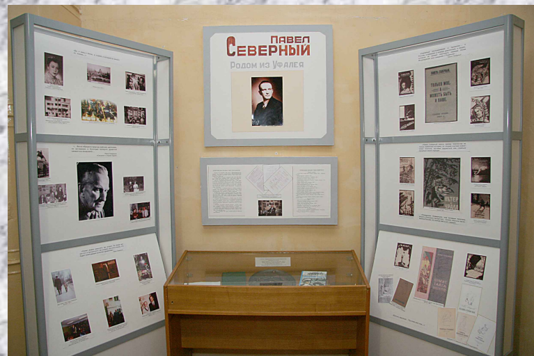
Выставка «Павел Северный»