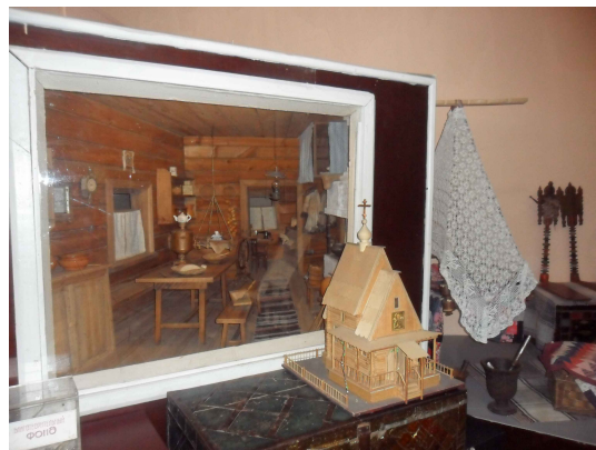
Этнографическая выставка «Русская изба»