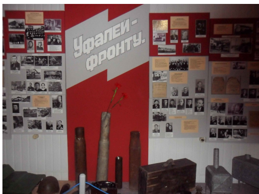
«Уфалей – фронту»