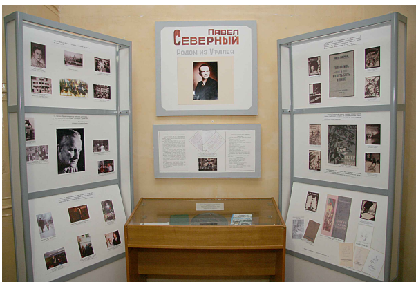
Выставка «Павел Северный»