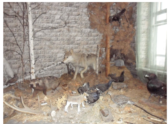
«Природа родного края»