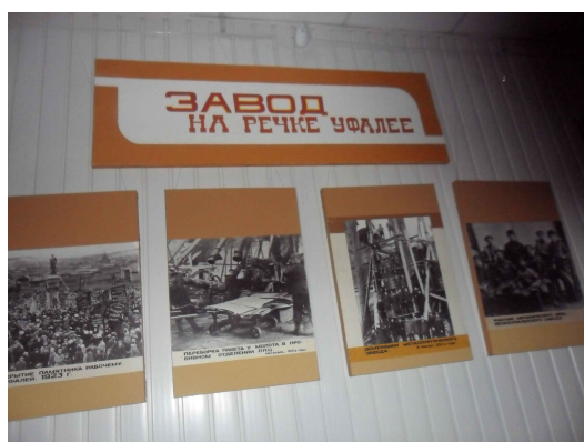
«Завод на речке Уфалее»