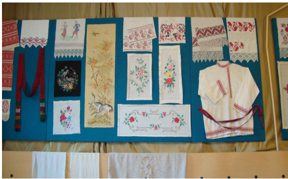
«Судьбы моей простое полотно» (льноделие)