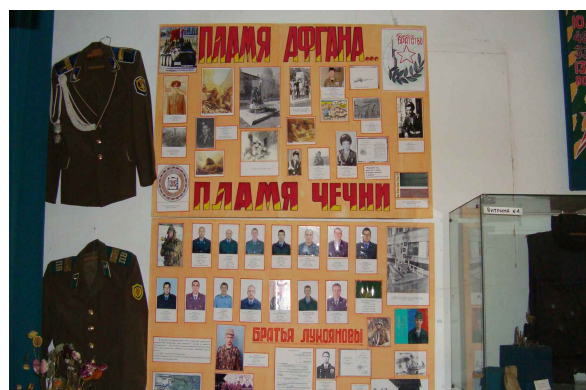
«В огне Афгана и Чечни»