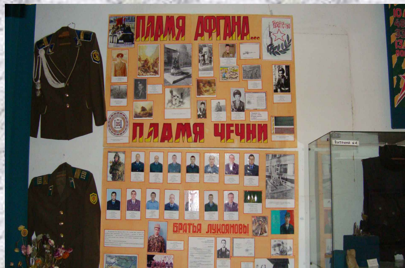
«В огне Афгана и Чечни»