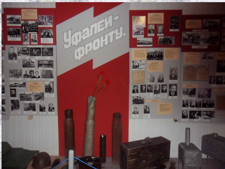
«Уфалей – фронту»