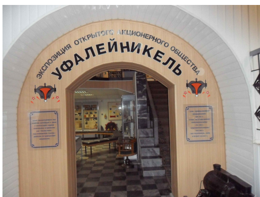
История ОАО «Уфалейникель»