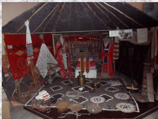
Этнографическая выставка «Башкирская юрта»