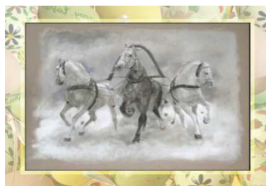
«На тройке» Ноябрь