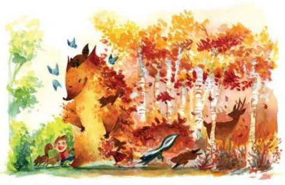
«Осенняя песнь» Октябрь