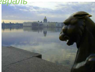
«Белые ночи» Май