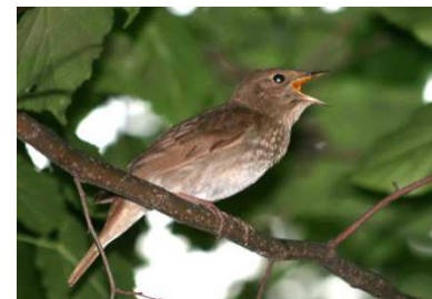
«Песня жаворонка» Март