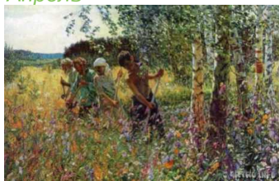
«Песнь косаря» Июль