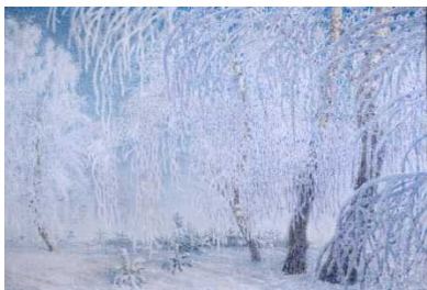
«У камелька» Январь.