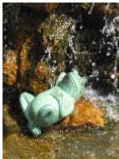
Лягушка в фонтане рядом с городским стадионом. Бульвар