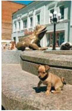
город Казань, ул. Баумана