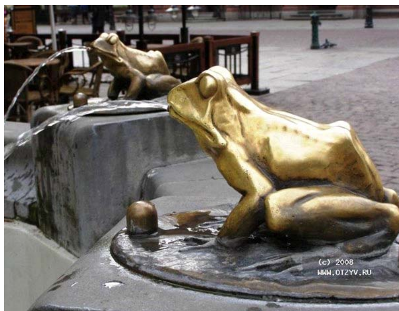
Польша, город Торунь