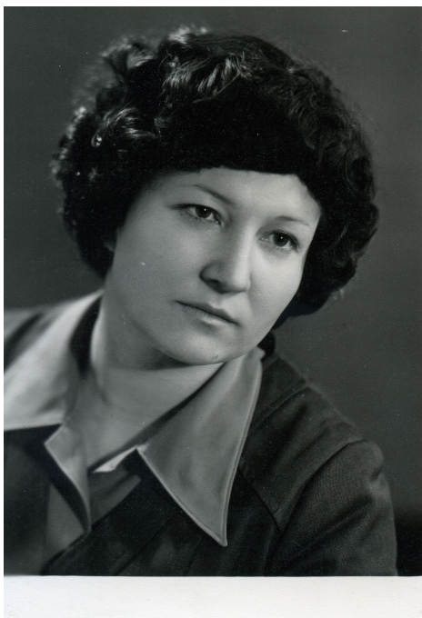
Фото № 12 (начало 80-х гг)