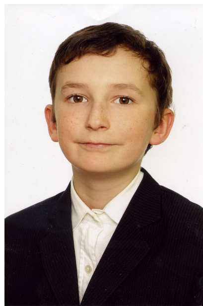
Фото № 17 (2010 г.)