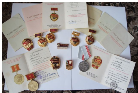
Удостоверения и знаки «Победитель Социалистического соревнования», «Ударник пятилетки», «Ударник коммунистического труда», медали «За доблестный труд» Славы и «Ветеран труда».