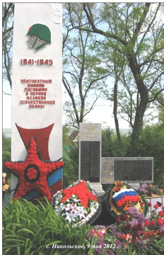
с. Никольское, 9 мая 2012 г.

В 1970 году прах погибших солдат перезахоронили в братской могиле в центре села. Каждый год 9 мая ветераны войны, жители села, ученики школы приходят к памятнику, чтобы почтить память погибших воинов и не вернувшихся с войны односельчан. Вечная память героям!