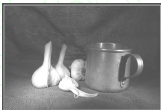
Рецепты военных лет:

12 января -3 февраля Висло-Одерская операция . Освобождение Польши. 4-12 февраля - Ялтинская конференция. 16 апреля - 8 мая - Берлинская операция . 19-25 апреля - окружение Берлина. 25 апреля - встреча союзников в Торгау. 30 апреля - взятие Рейхстага. 2 мая - капитуляция берлинского гарнизона. 5 мая - антифашистское восстание в Праге. 8 мая - капитуляция Германии. 9 мая - День Победы. 17 июля - 2 августа - Потсдамская конференция. 8 августа - 1 сентября - советско-японская война. 2 сентября 1945 года - капитуляция Японии. Окончание Второй мировой войны.