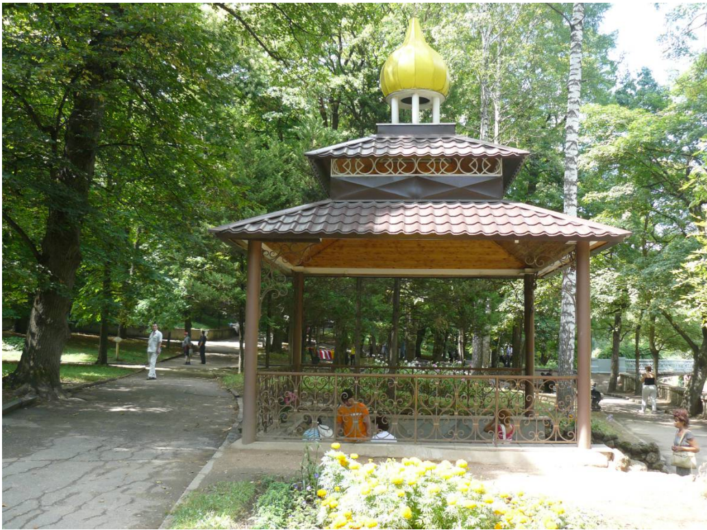
Родник «Накладезная часовня»