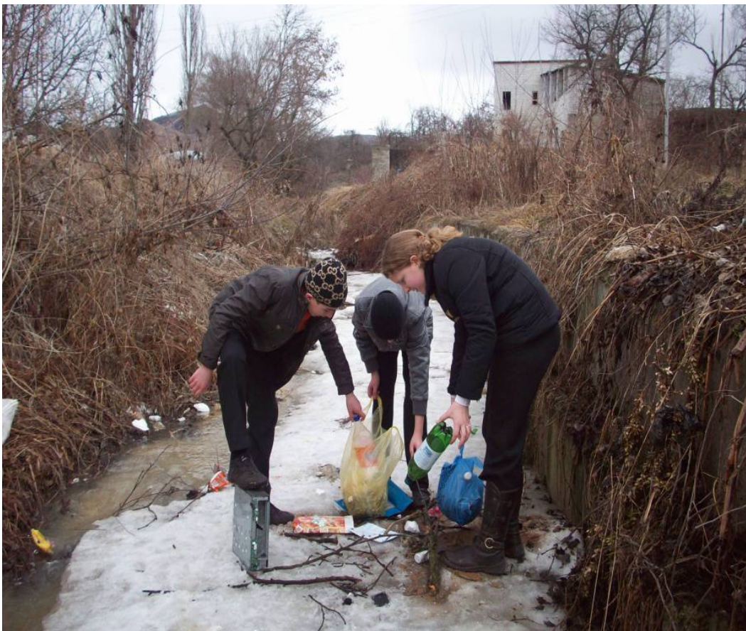
Рейд по очистке реки Белой.