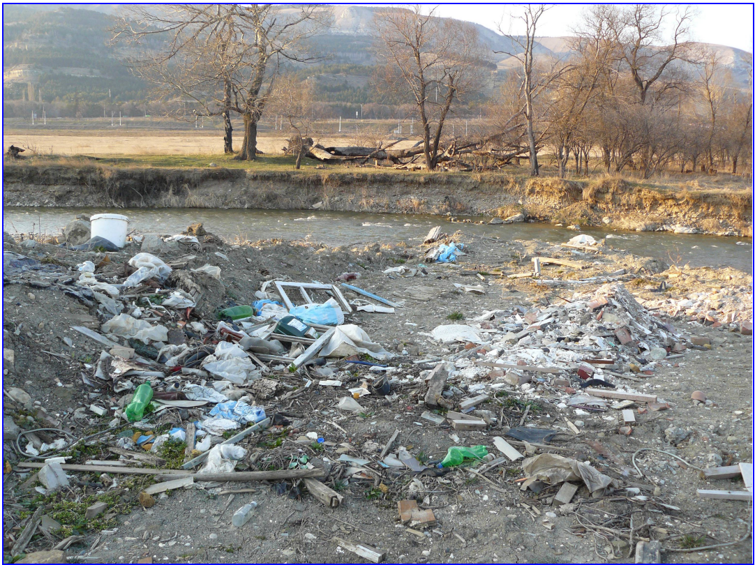
. Свалка на берегу реки Подкумок