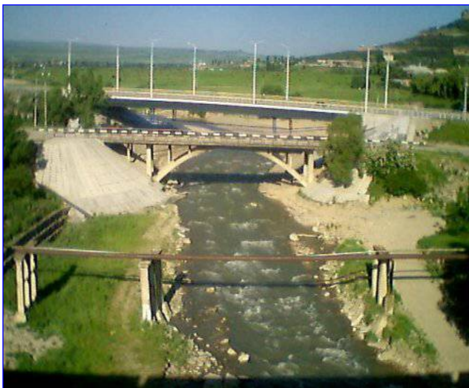
. Река Подкумок.