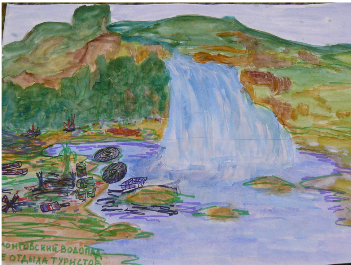
Рисунок Байгильдиевой Дианы 6 класс.