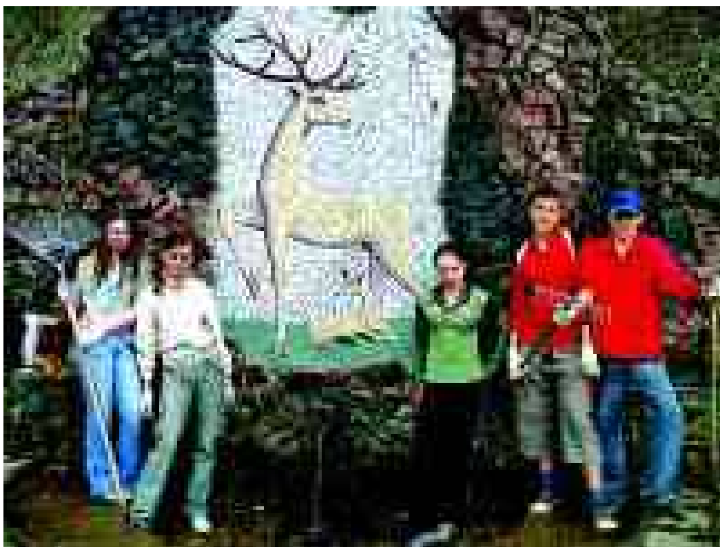
Родник города Ессентуки.