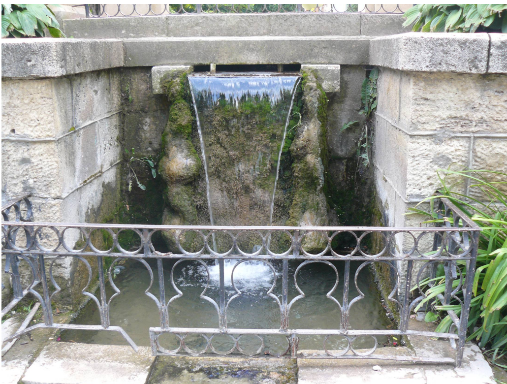
«Стеклянная струя» или «Семиградусный источник»