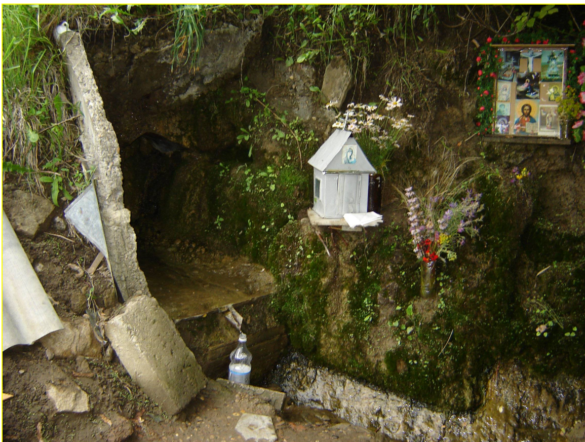
Родник «Богороды слезки»