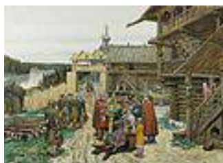
Двор удельного князя. Картина А.М. Васнецова