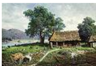
М. К. Клодт. Крестьянская усадьба у реки. 1858