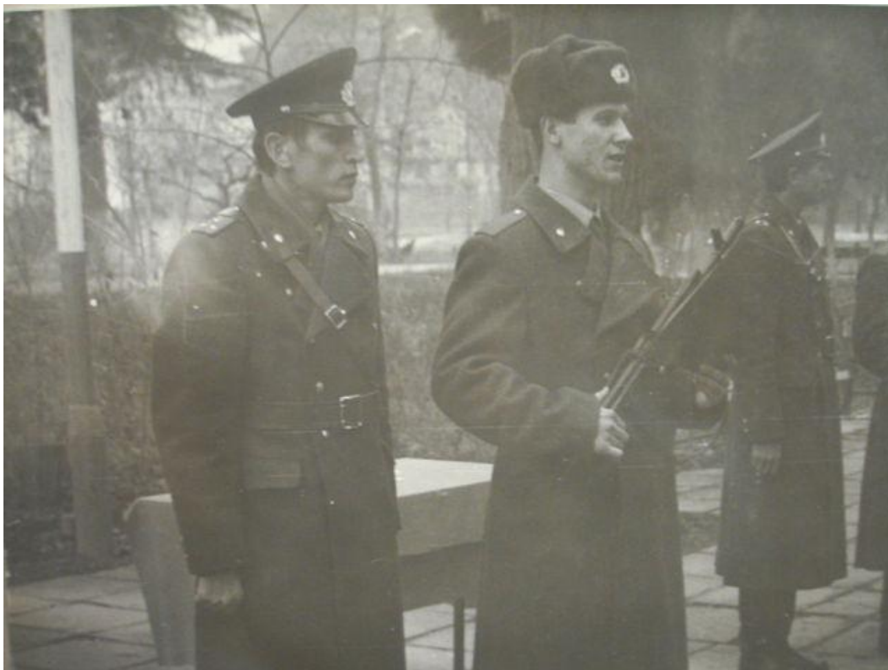
Войсковая часть 5477. Присяга 1989 г.