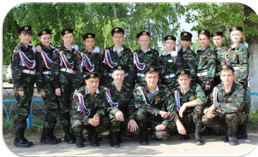
Курсанты ВПК "Регион-63" им.А.В.Липатова ГБОУ СОШ им.М.К.Овсянникова с.Исаклы