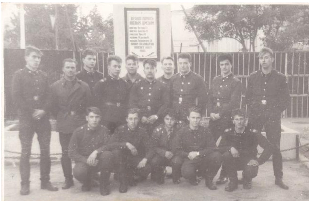
СТЕЛА на территории 5477 г. Гянджа в память о погибших